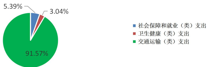
2022年一般公共预算财政拨款支出情况

招远市交通运输局机关 2022 年一般公共预算支出为 291.91 万元，其中：社会保障和就业（类）支出 15.76 万元，占 5.39%；卫生健康（类）支出 8.90 万元，占 3.04%；交通运输（类）支出 267.25 万元，占 91.57%。